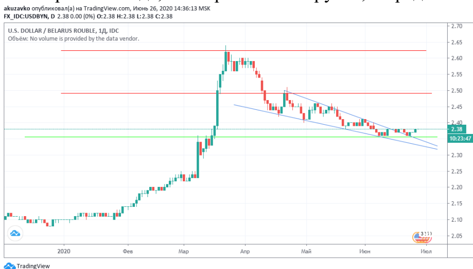
Рисунок 2 – Технический срез пары USD/BYN на дневном графике

Как видно из графика (рис. 2), белорусский рубль выглядит не хуже российского, относительно докризисного курса. По состоянию на 26 июня 2020 года курс белорусского рубля девальвирован к уровню января 2020 года, как и российский рубль, в пределах 12%.