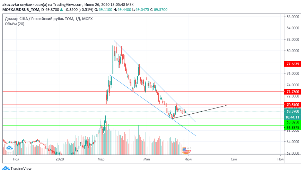
Рисунок 1 – Технический срез пары USD/RUB на дневном графике

Известно, что фундаментальные факторы задают направления движения, а технические – диапазон этого движения. Как видно из рисунка 1, пара USD/RUB пробила 1 июня 2020 года сильный уровень поддержки в районе 70,5 руб.